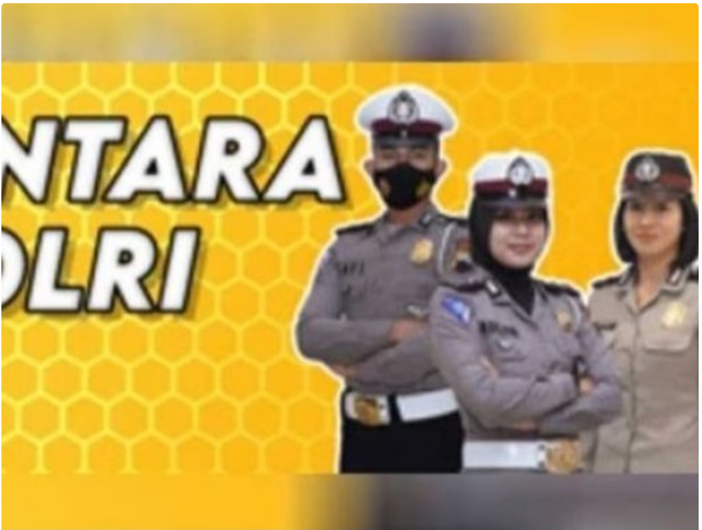
Penerimaan Polri Bakomsus

PALANGKA RAYA - Kesempatan terbuka bagi lulusan bidang pertanian, perikanan, peternakan, gizi, dan kesehatan masyarakat untuk bergabung menjadi